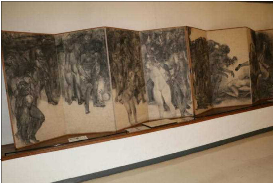
原爆の図 幽霊 — 第一部

先月、原爆の図丸木美術館に行ってきました。40年以上前に行ったことのある美術館ですが、ウクライナ戦争でプーチンが核による威嚇を続けているので、もう一度行ってみることにしました。この美術館は、丸木位里・俊夫