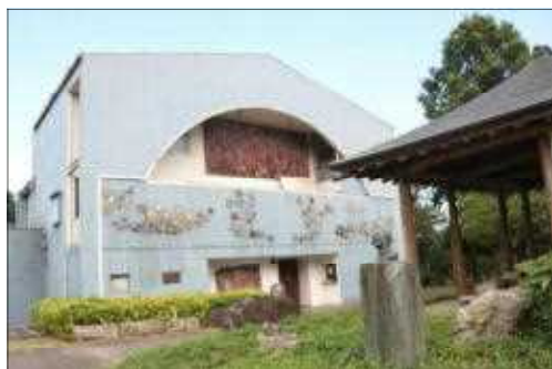
原爆の図丸木美術館 （埼玉県東松山市）