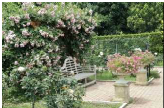
花菜ガーデン(平塚市)